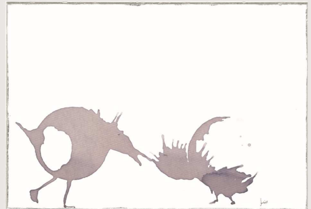
Chateau Moulin de l'Espérance

Zu besonderen Anlässen - Jubiläum, Hochzeit, Geburtstag - fertige ich Ihre Grafiken auf Wunsch auch gerne vor Ort und in Serie an.