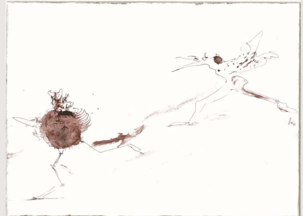
Domaine de Balaussan